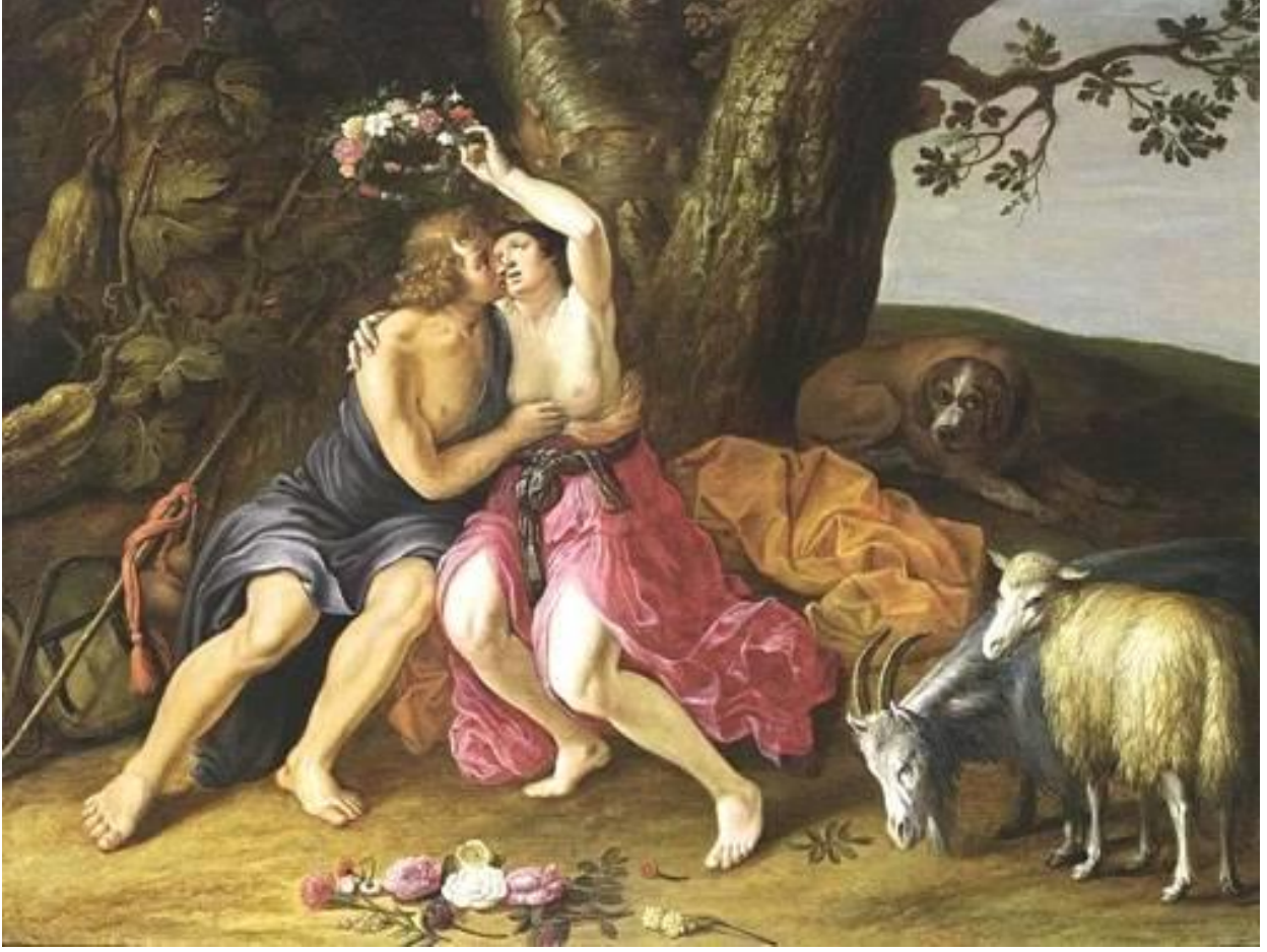
Adriaen van Nieulandt'ın, Sadık Çoban'dan bir sahneyi canlandırdığı, 1648 tarihli, "Amarillis Mirtillo'ya Taç Takıyor" adlı tablosu