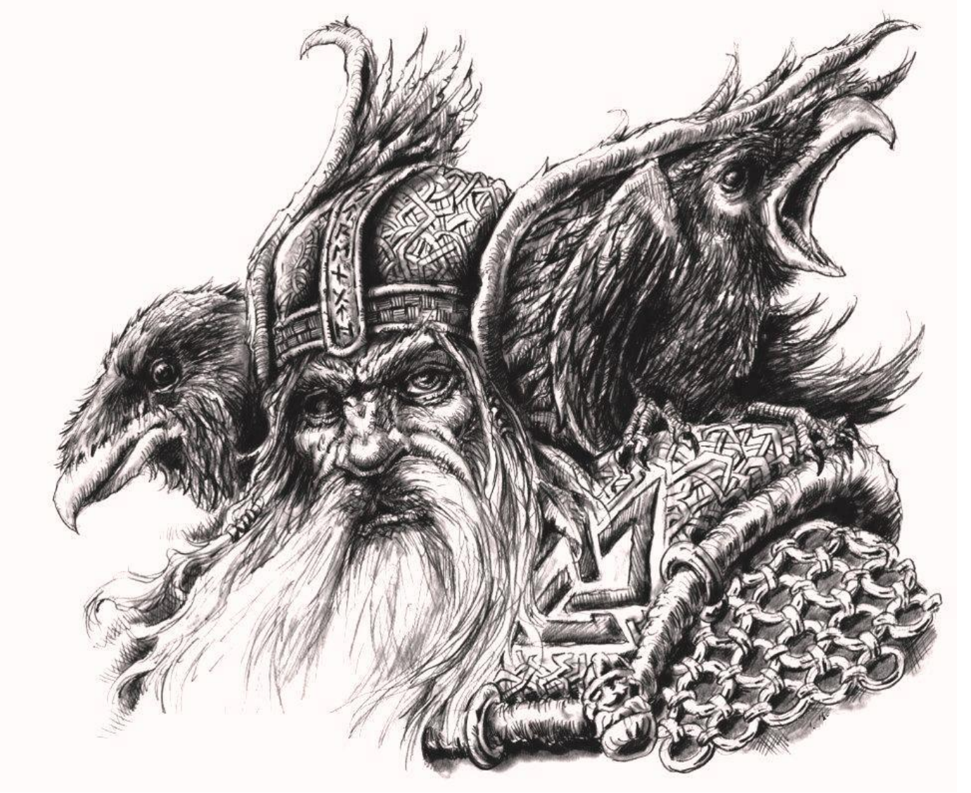
Edda figürü, Tanrı Odin ve iki kuzgunu; Hugin (Düşünce) Munin (Bellek)

Klasik Batı Edebiyatı Fanzini Ekim 2021 Sayı: 2