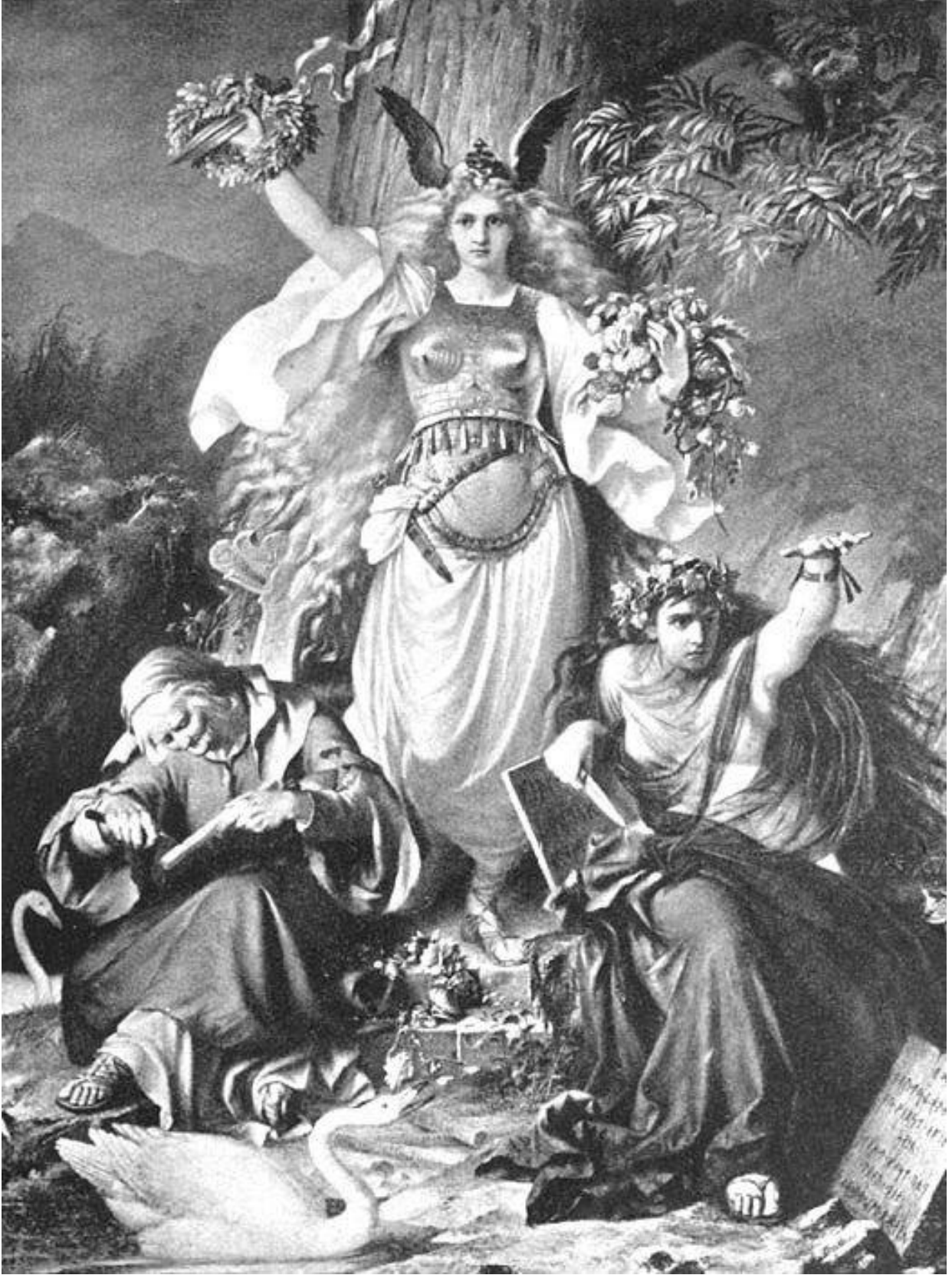
Eski Edda'dan, "Grimnir'in Şarkısı" ile ilgili bir resim